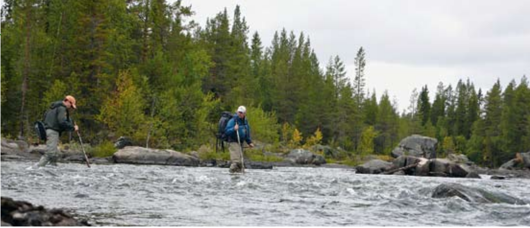
Flussquerung im knöcheltiefen Wasser mit mächtig Dampf. Wathose und -schuhe mit Profil sind am Pite Älv Pflicht