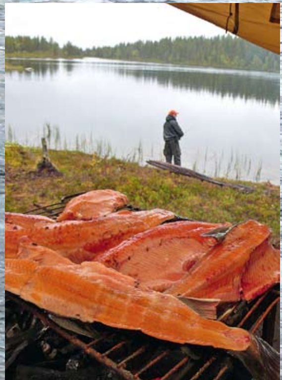
Die Fliegenrute Klasse 6 war der richtige Partner für dieses dicke Saiblings-Männchen