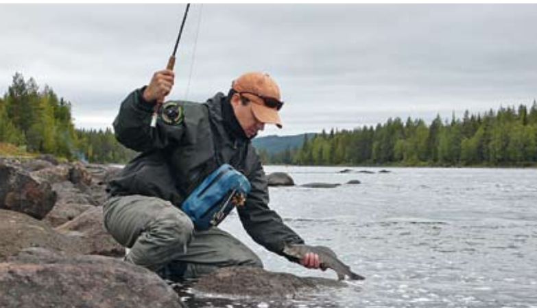
0,17er Fluorocarbon-Vorfachspitze war für die Pite-Äschen perfekt