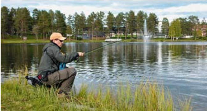
Direkt vor dem Hotell Laponia wartet ein See voller Salmoniden